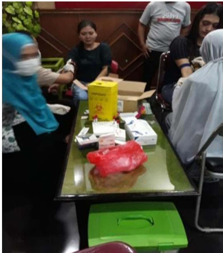
Gambar 2. Proses Pengambilan Sampel darah