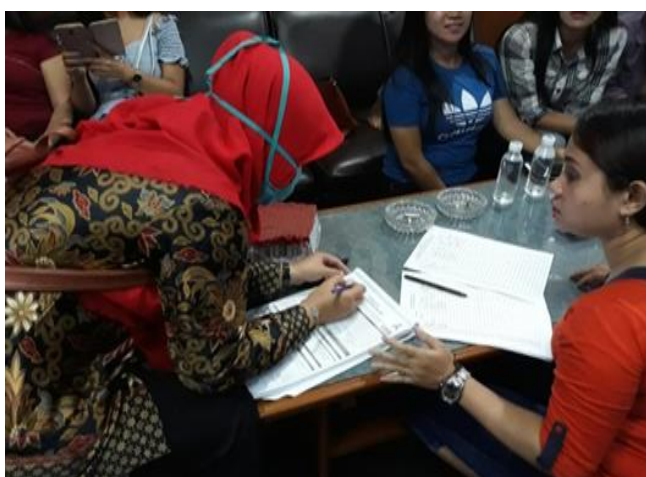
Gambar 1. Kegiatan Konseling PraTest

Mobile VCT merupakan bagian dari program pencegahan dan pengendalian HIV/AIDS dimana pelaksanaannya dilakukan dengan cara memberi pelayanan secara langsung dengan cara menemui sasaran. Keberhasilan suatu VCT dilakukan apabila pada setiap layanan jumlah sasaran yang mengikuti kegiatan sudah lebih mudah untuk melakukan konsultasi atau lebih terbuka, selain itu jumlah pemanfaatan layanan mobile VCT tahun 2018 di kabupaten Cirebon, pada populasi kunci WPS (Wanita Penjaja Seks) dimana target sebanyak 300 dan capaian sebanyak 188 (62%), kemungkinan tidak terpenuhinya target tersebut karena informasi atau pada saat waktu yang bersamaan sasaran/klien tidak dapat hadir (Kemenkes, 2019).